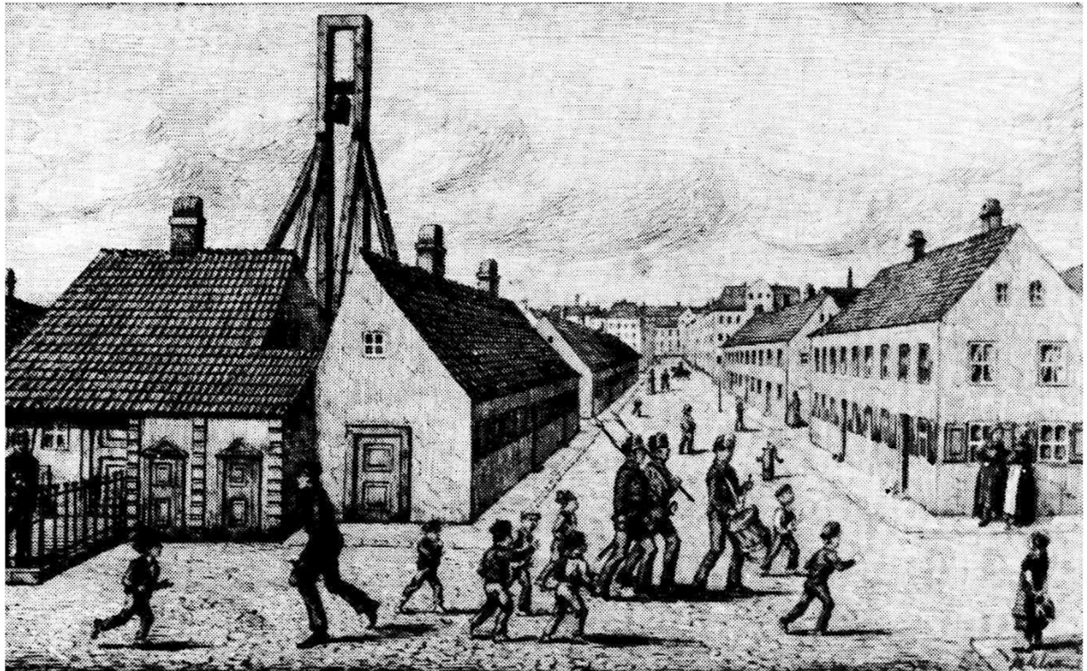
Gl. Vagt, hvorfra tappenstregen udgik. Et symbol på statsmagtens kontrol med Nyboder-beboerne. Klokkeren klyngede, når arbejdsdagen begyndte, og tappenstregen angav arbejdsdagens ophør. Arrestlokalet i Vagten kunne huse opsætsige beboere

Saadan veed I nok Muntrer sig den faste Stok. Ja med Slid og Slæb Under Holmens Chef. Ugen gaaer med Sjou,