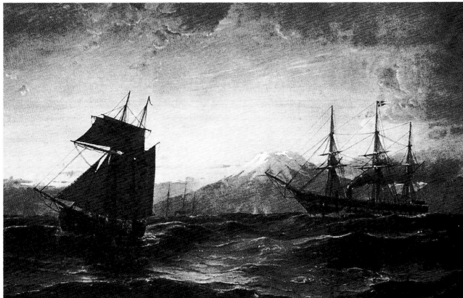
Fregatten Jylland under Island

Det var den eneste gang, JYLLAND var i kamp. De næste 30 år fungerede skibet som uddannelsesskib i danske farvande afbrudt med togter til Middelhavet og De Dansk-Vestindiske Øer. I 1874 og 1876 fungerede fregatten endvidere som kongeskib for Christian IX på togter henholdsvis til Island i forbindelse med Islands tusindårsfest og til Rusland med Kong Christian IX og Kong Georg I af Grækenland.